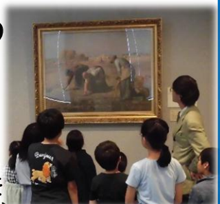
写真は昨年の様子